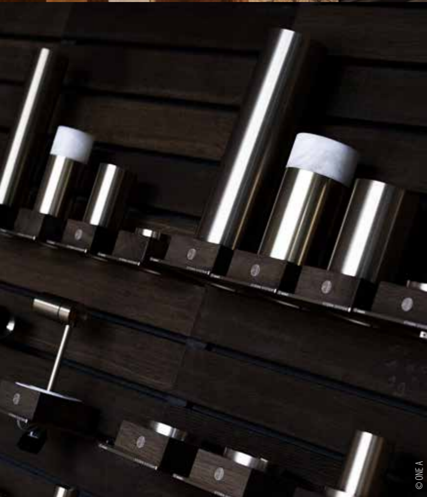
LAMPE JB ONE MIT INTEGRIERTER SMARTPHONE STATION